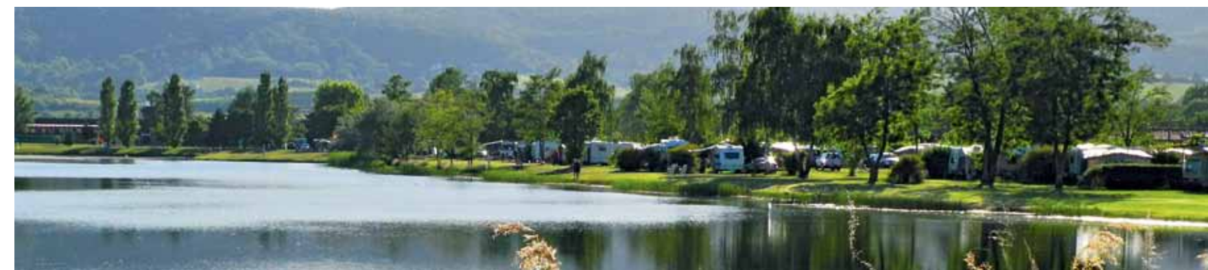
Nahe der pfälzischen Kurstadt Bad Dürkheim, an der Deutschen Weinstraße, liegt der beliebte und mit 4 Sternen ausgezeichnete Knaus Campingpark ( www.knauscamp.de/Camp_Bad_Duerkheim.html ).