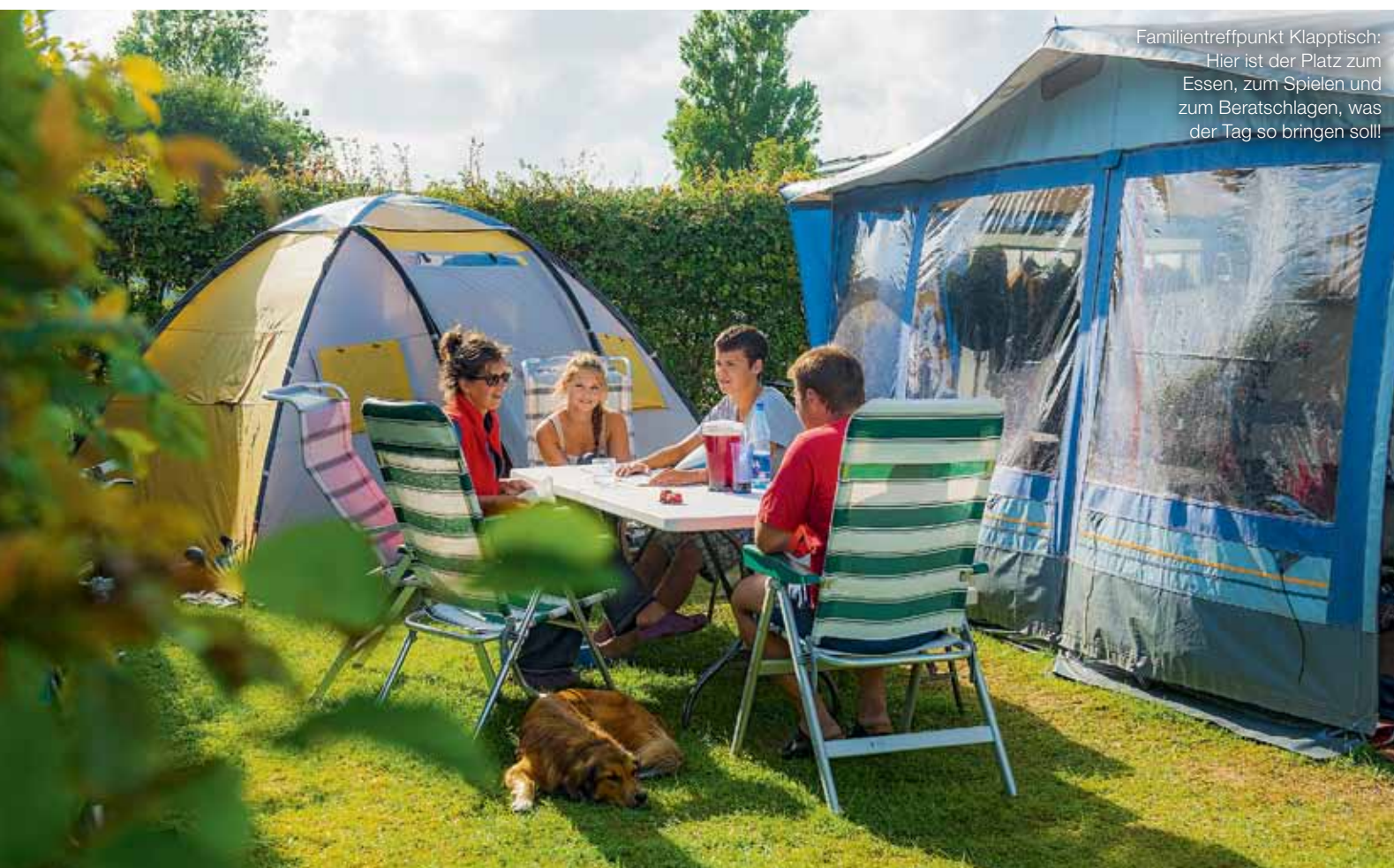
Familientreffpunkt Klappstisch: Hier ist der Platz zum Essen, zum Spielen und zum Beratschlagen, was der Tag so bringen soll!