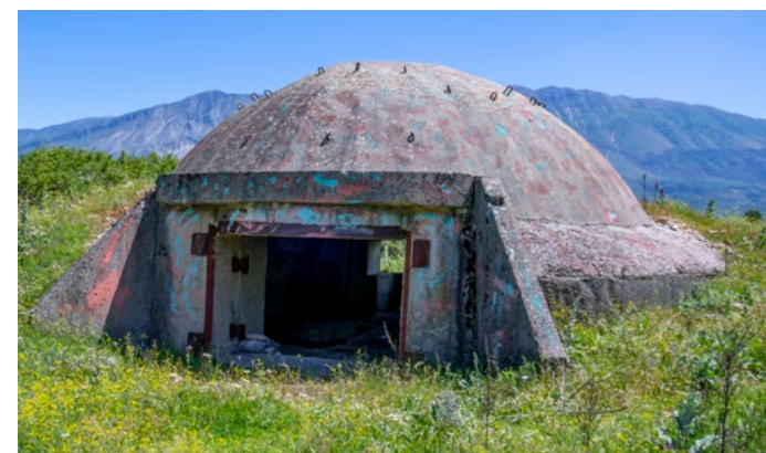
Über 170 000 Bunker sind als stumme Zeugen in ganz Albanien verteilt. Dieser in Kampfhelm-Optik überwacht das Tal des Drino südlich von Gjirokastra.

Die Anreise nach Albanien ist Teil des Abenteuers. Von Deutschland aus führen verschiedene Routen über Österreich, Slowenien, Kroatien und Montenegro oder alternativ über Serbien. Wer die Reise abkürzen möchte, kann auf Fährverbindungen von Italien (zum Beispiel Bari oder Ancona) nach Durrës oder Vlorë zurückgreifen. Die Straßenverhältnisse ha-