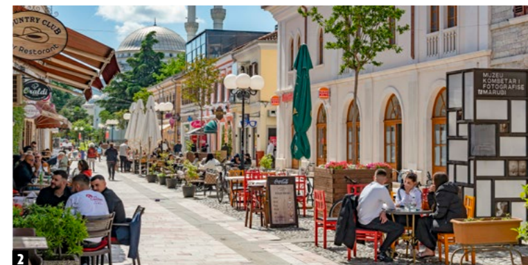
1 Wildes Camping ist nach Absprache mit Grundstückseigentümern meist problemlos möglich – wie hier in der Bucht von Porto Palermo an der albanischen Riviera. 2 Ideal zum Flanieren: Shkodras Fußgängerzone Rruga Kolë Idromeno.

Auslandsaufenthalte. Google Translate hilft. Nützliche Phrasen: Faleminderit (Danke), Ju lutem (Bitte), Përshëndetje (Hallo), Mirupafshim (Tschüss). Schilder meist nur albanisch, in Touristenbereichen teils englische Ergänzungen.