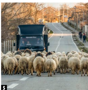
1 Korça ist Zentrum albanischer Bildung. Es lohnt der Blick in die orthodoxe Kirche St. Anna. 2 Hirtenromantik über dem Skutarisee. 3 Bunt und geschäftig: In Kruja führt der Weg von der Stadt zur Burg durch den alten Basar. 4 Ideal für Camper: Shëngjin mit seinen zum Teil unberührten Sandstränden. 5 Typisch Albanien: Schafherden haben Vorfahrt und blockieren gelassen den Verkehr. 6 Ein Highlight auf der Küstentour ist die versteckte Grama-Bucht.